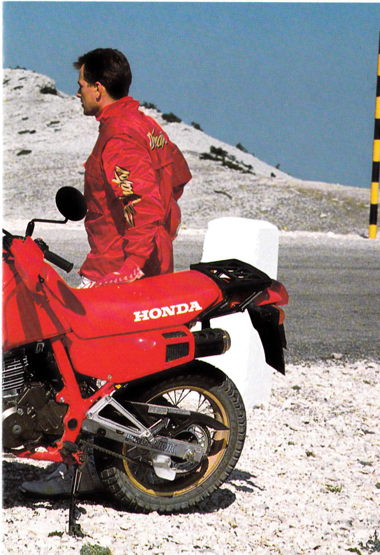
Fotografien wurden mit einem professionellen Motorrad-Fahrer gemacht.

Das nahtlos in die Verkleidung integrierte Armaturenbrett, die zum Tank hochgezogene Sitzbank, der große Scheinwerfer vorn, das Rücklicht - kein Teil, das sich nicht harmonisch in die perfekte Linienführung der Dominator einfügt. Bestes Beispiel für die ausgefeilte Verarbeitung ist die Sitzbank, die in Form, Höhe, Abmessung und Material den Bedürfnissen des Fahrers angepaßt wurde. Damit der Fahrer nicht nur auf dem Motorrad Platz nimmt, sondern geradezu mit ihm verwächst.